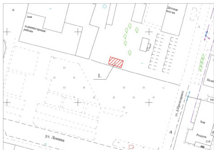
Приложение № 2 к схеме Дислокации размещения объекта по оказанию услуг населению ПАРК «КАЧЕЛИ» (ул.Ленина)