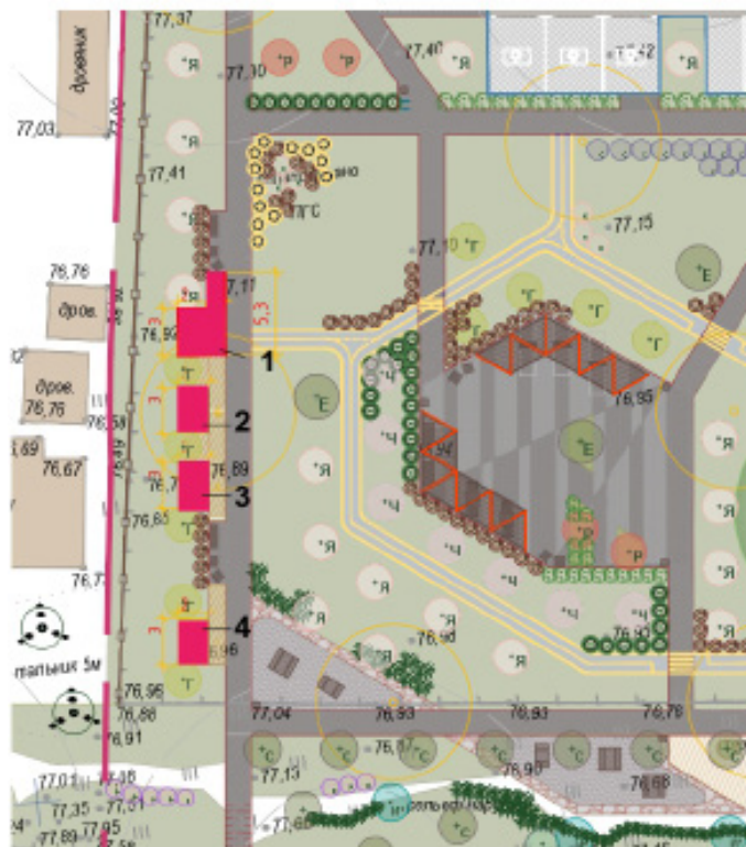
Приложение № 5 к схеме Дислокации размещения объекта по оказанию услуг населению Парк «Кедровая речка»