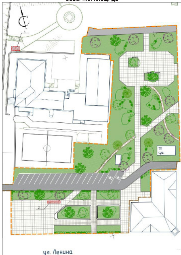
Приложение № 3 к схеме Дислокации размещения объекта по оказанию услуг населению СОБОРНАЯ ПЛОЩАДЬ