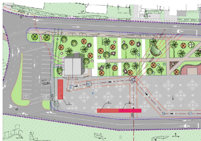
Приложение № 1 к схеме Дислокации размещения объекта по оказанию услуг населению СКВЕР МОНАСТЫРСКИЙ