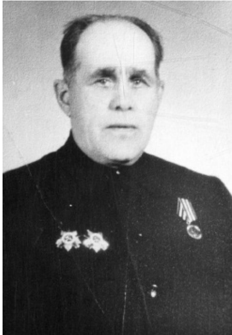
22 июня 1941 года в 4 утра без объявления войны фашистская Германия и её союзники напали на Советский Союз.

Части Красной Армии были атакованы немецкими войсками на всём протяжении границы. Бомбардировкам подверглись приграничные города, села, железнодорожные